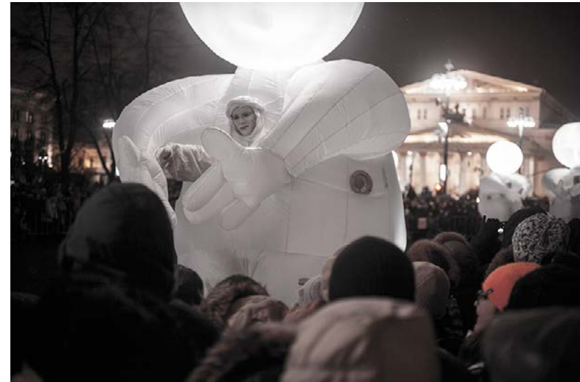
... s'illuminent et déambulent parmi la foule.