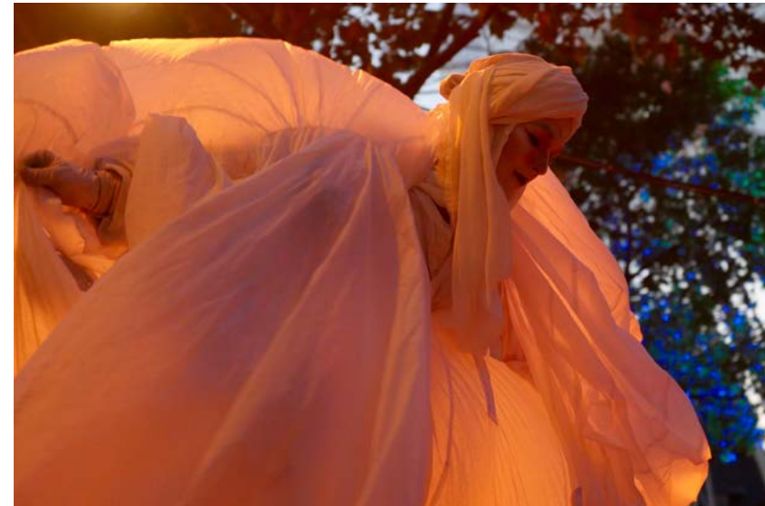
...puis se transforment...