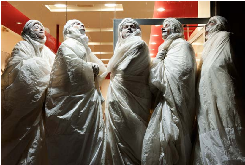
Les personnages débutent drapés...

déambulation silencieuse (sans musique) : 25 à 30 minutes